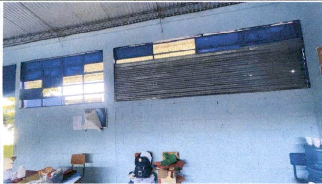
Foto7: Ventanales en aulas