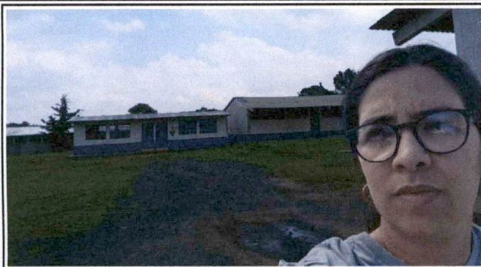
Foto1: Foto consultor